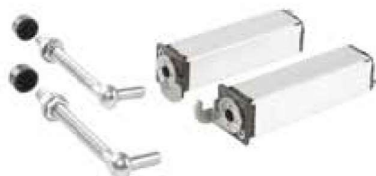
Charnière à ressort