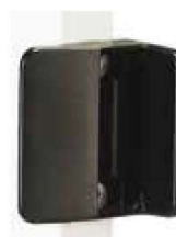
Gâche STK QF