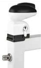
Serrure Locinox Twist 40